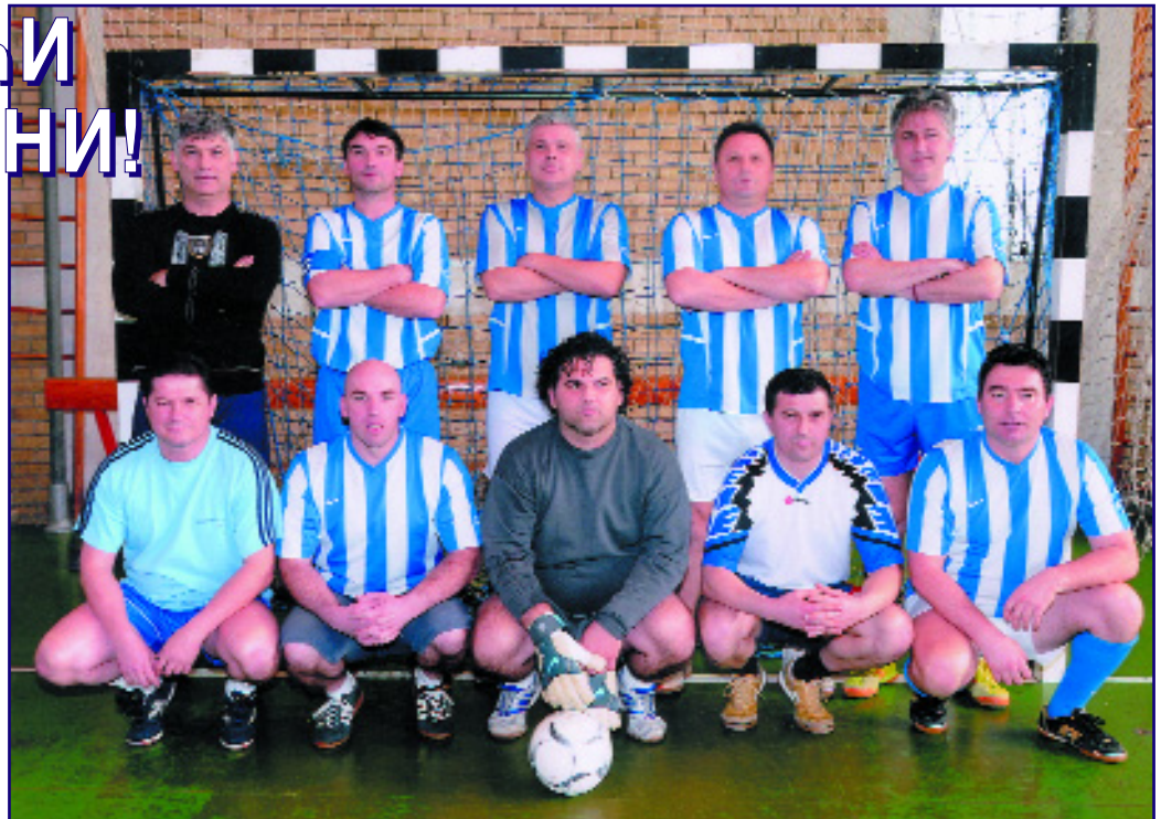
Екипа "Девет Југовића"

Титула најбољег је посебно значајна јер је освојена у сезони када екипа после много година заједничких игара није носила бремене фаворита. Управо то је можда и кључни разлог тријумфа. Наиме, осим