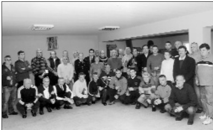
Награђени чланови ДВД-а

Поред тога биће настављене активности на обезбеђивању новчаних средстава за побољшање услова рада. Реч је пре свега о набавци опреме, опремању возила,