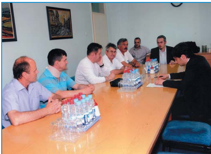
Безбедност и здравље запослених приоритет

моменат један од значајних разлога за смањење броја повреда. Поред предузимања мера безбедности и здравља на раду неопходно је предузети мере у циљу спречавања злоупотреба по том основу. Имајући у виду наведено руководство предузећа (директор и помоћници) ће у наредном периоду вршити увид у писмене доказе о настанку повреде и после тога биће донета одлука о признавању повреде на раду.