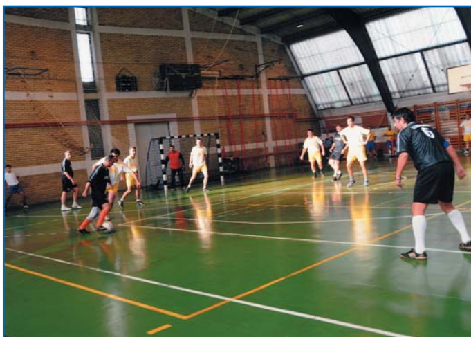
Духови - Кондорси

Овом приликом подсећамо да је организатор овогодишње лиге у малом фудбалу Друштво за рекреативни спорт "Партизан", као и да се мечеви играју у Сали ОШ "Прва Војвођанска бригада" у Новом Саду. Лига се завршава у недељу 27. фебруара.