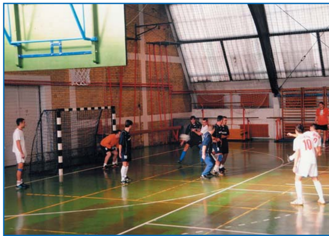
Радићи - Манекени