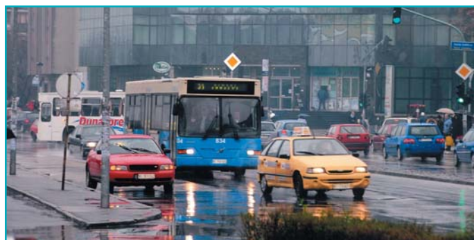
Нова одлука о јавном превозу

Системско бројање је показало и да се времена обрта