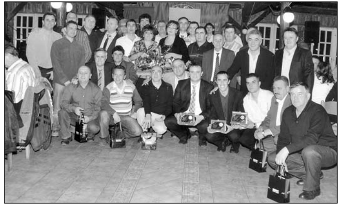
Примерни чланови удружења

Као и сваке године и ове су на свечаности пролашени примерни возачи и остали чланови Удружења возача и аутомеханичара.