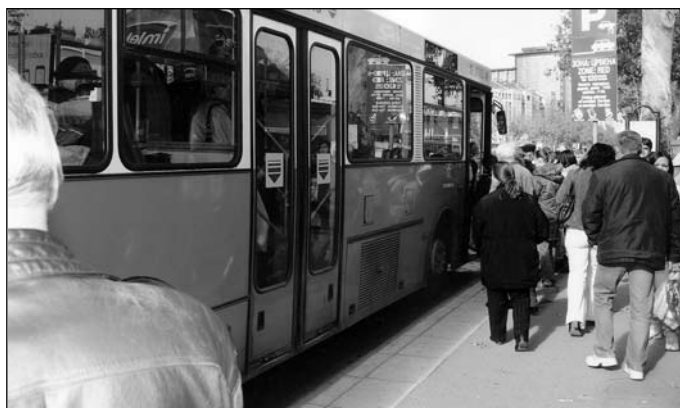
Бесплатне карте продужене до 31. марта

Такав приступ ове године омогућава грађанима Новог Сада старијим од 65 година да у оквиру наше проширене продајне мреже, на више места подносе захтеве за израду бесплатне карте и тако на једно-