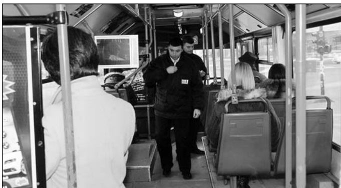
Редовна контрола карата

Техничка лица из нашег предузећа договарали су се са представницима Ирибус-а из Републике Хрватске из Загреба и са званичним дистрибутерима Ирибус-а Генерал Аутом из Новог Сада о обукама које предстоје пре испоруке и након испоруке аутобуса мањег капацитета погоњена на природни гас.